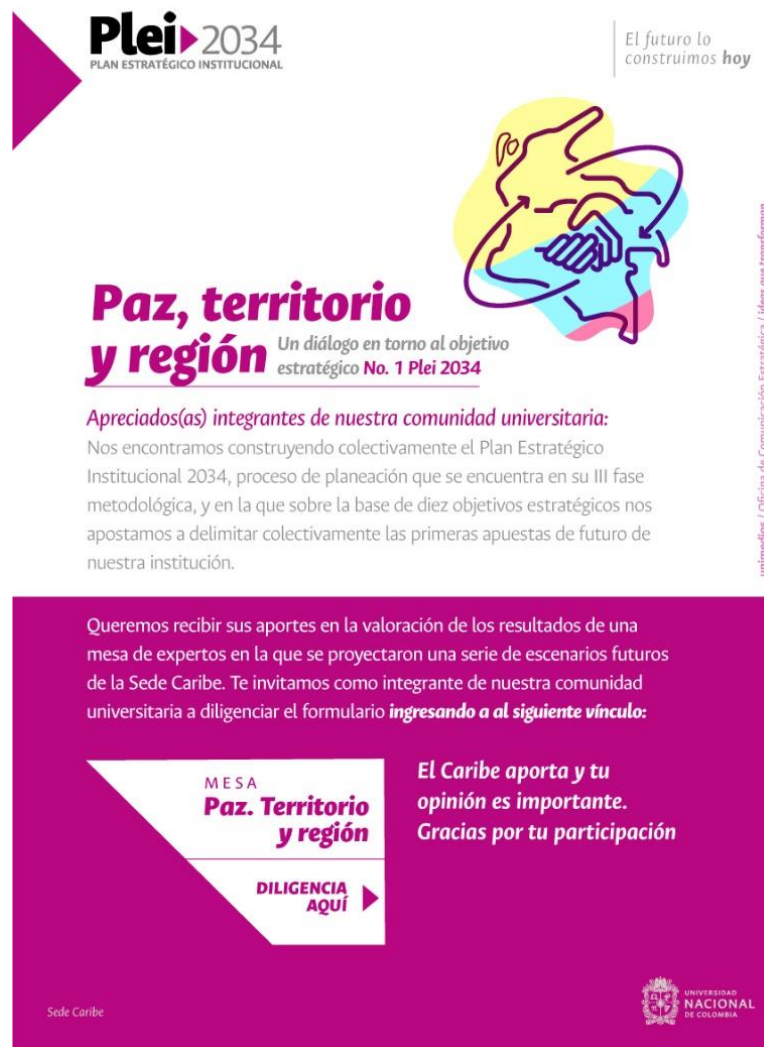
Figura 1. Mailing divulgativo de la encuesta mesa 1

Desde la Dirección de Sede se promovió la participación de la comunidad académica, remitiendo a los diversos estamentos mailing divulgativo de la encuesta: